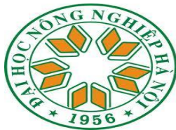
Đại học Nông nghiệp Hà Nội