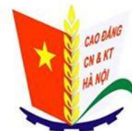
Cao đẳng Công nghệ Kinh tế Hà Nội