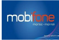
Công ty thông tin di động Mobifone